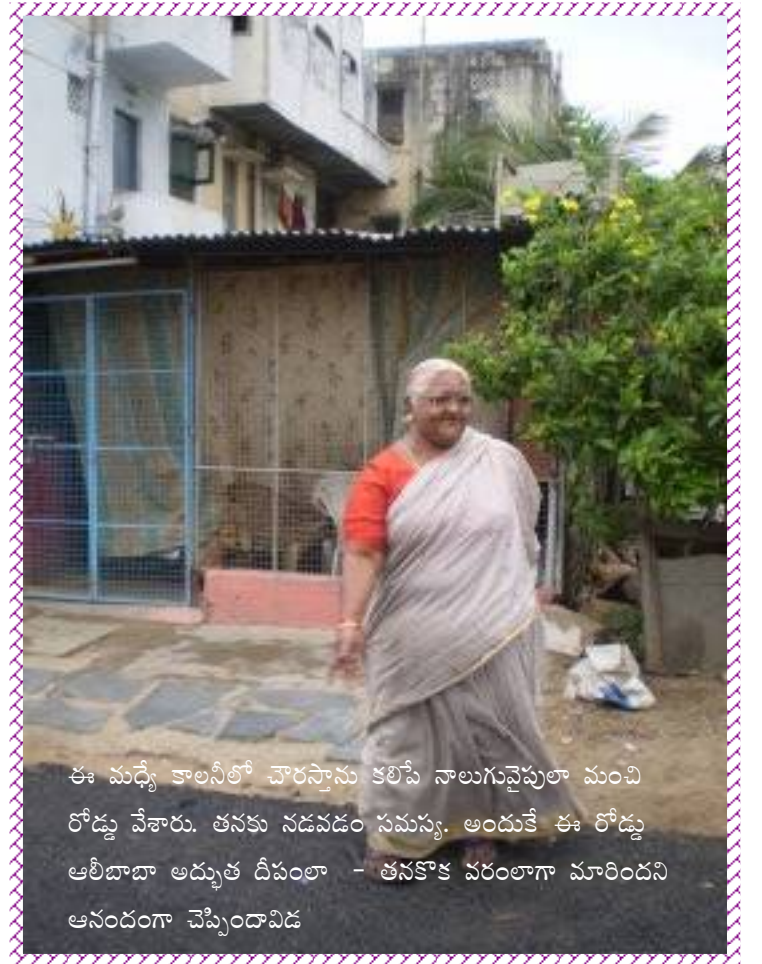
ఈ మధ్యే కాలనీలో చౌరసాను కలిపి నాలుగువైపులా మంచి రోడ్లు వేశారు. తనకు నడవడం సమస్య. అందుకే ఈ రోడ్డు ఆలీబాబా అద్భుత దీపలా - తనకొక వరంలాగా మారిందని ఆనందంగా చెప్పిందావిడ