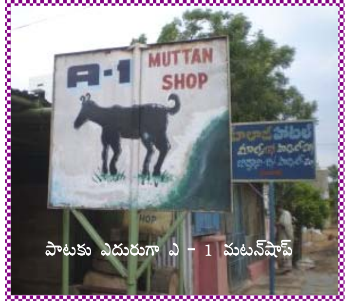
పాటకు ఎదురుగా ఎ - 1 మటన్‌షాప్

ఎస్‌ఎస్‌ఎల్సీ చదివినదట. క్రమం తప్పక దిన పత్రికలు చదువుతుందట. వీక్షిలు చదువుతుంది. పత్రికలకు ఉత్తరాలు రాయడం ఆమె హాబీల్లో ఒకటి, సినిమాలన్నా, నాటకాలన్నా ఇష్టం, అంది.