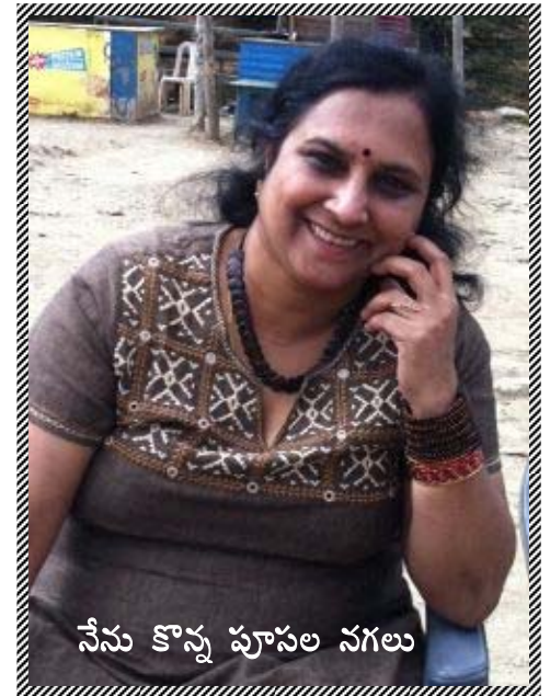
నేను కొన్న పూసల నగలు

అక్కడ ఒక వేడి టీ తాగి, ఈసారి గుర్రాలని మార్చుకుని కిందకి వస్తుంటే మళ్ళీ చాలా భయం వేసింది!