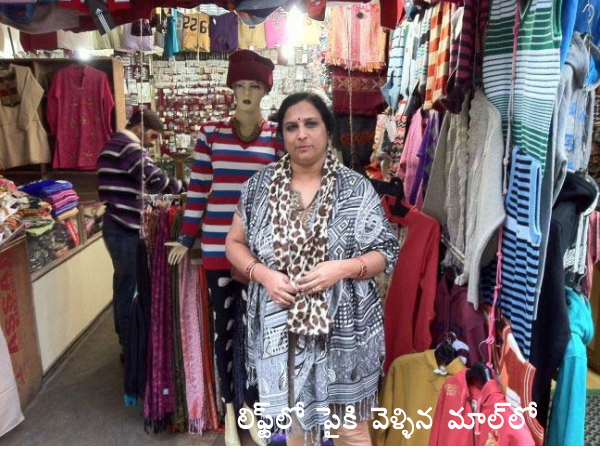
లిఫ్ట్ లో పైకి వెళ్ళిన మాలాలో

మేం వెళ్ళబోతుంటే ఆపి "మేరీలియే గుప్తాజీ ధాబా సే ఖానాలాయియే! కడీ వహాకి స్పెషల్ ప్లా" అన్నాడు.