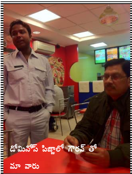
డోమినోస్ పిజ్జాలో గౌరవ్ తో

I have to go many miles.... Before I sleep.