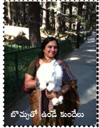
బొచ్చుతో ఉండే కుండేలు

వశిష్టా టెంపుల్ లో స్నానకుండోలో భూమిలోంచి వేడి వేడి నీటి ఊట వస్తుంటుంది. మామూలు వేడికాదు, ఆ మంచులో మరుగుతున్న నీళ్ళు! అది ప్రకృతిలో వింత! ఆడవాళ్ళకీ మగవాళ్ళకీ ప్రత్యేకమైన