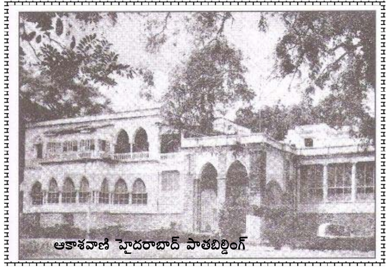
ఆకాశవాణి హైదరాబాద్ పాతబిల్డింగ్

Click here to share your comments on this article