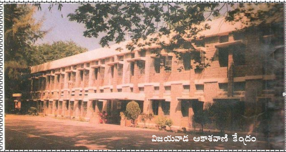
విజయవాడ ఆకాశవాణి కేంద్రం