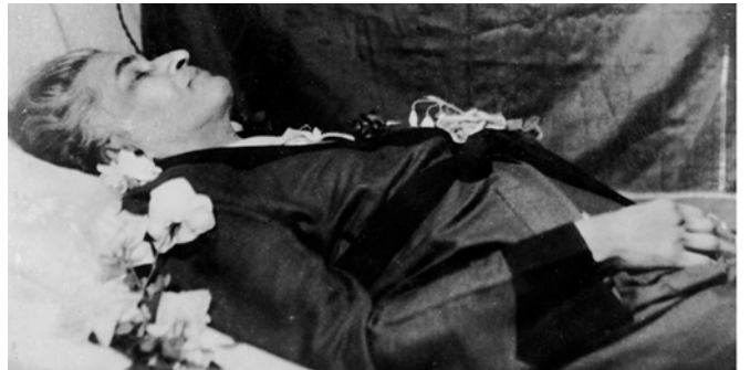
1954 జనవరి 26న మరణించిన ఎమ్.ఎన్.రాయ్

అమెరికా వెళ్ళి కొన్ని యూనివర్సిటీలలో ప్రసంగించడానికి కార్యక్రమం ఏర్పాటుయింది. అటువంటి సమయంలో ఈ ఘటన జరిగింది.