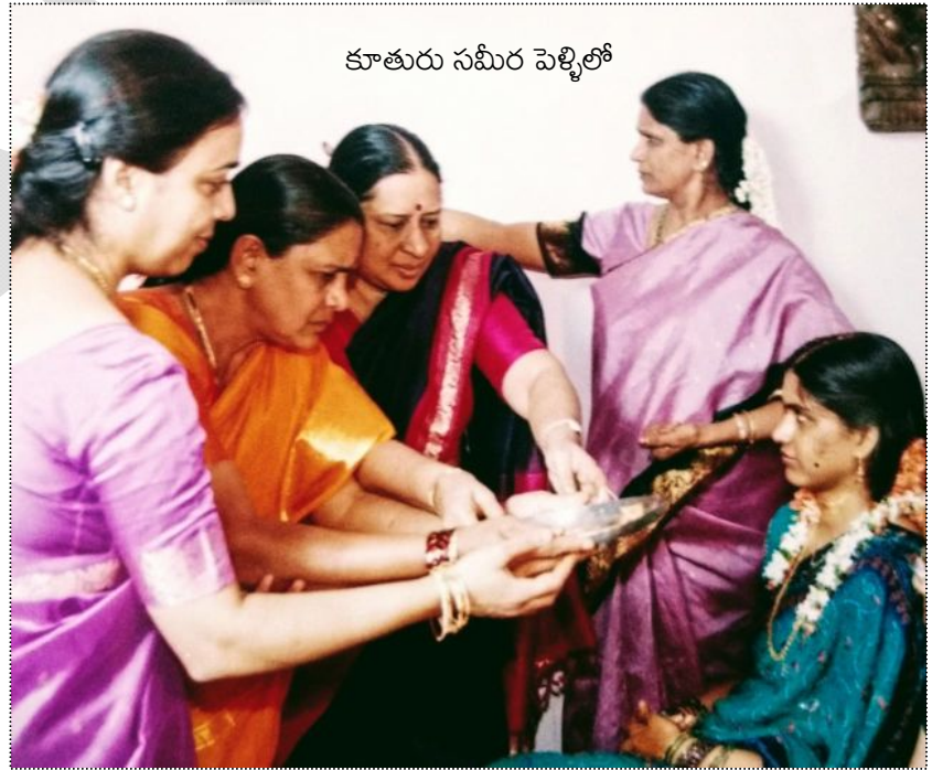
కూతురు సమీర పెళ్లిలో

మేము శ్రీనగర్ కాలనీలో ఉండగా ఎన్నోసార్లు తను మా ఇంటికి వచ్చింది, నేనూ తనింటికి వెళ్లాను. మా బాల్యనీలో మొక్కల మధ్య కూర్చుని 'ఇక్కడకూచుంటే చేతిలో కాఫీ ఉండాలి' అని డిక్టేర్ చేసి, కమ్మని కాఫీ ఇస్తే, అంతకన్నా కమ్మని కబుర్లు చెప్పి వెళ్లేది. అప్పట్లో మొక్కలకున్న పండుటాకులు తుంచి తీసేయడం నాకు ఇష్టం ఉండేది కాదు. ఒకసారి గుబురుగా ఎదిగిన