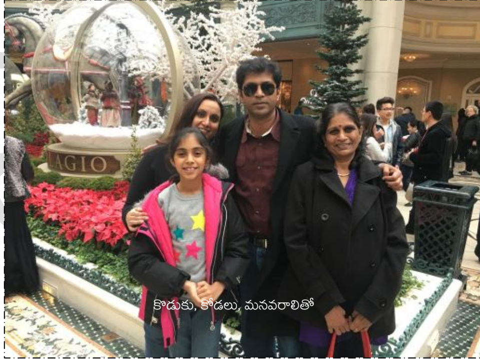
కొడుకు, కొండలు, మనవరాలితో

She was strong-willed, independent, supremely talented, enormously versatile, gracefully humble, poignant in demeanor, ever friendly and everything else that makes her one in a billion. Laughter and goodwill for others were her constant companions. Her love for literature was