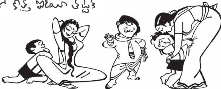
(మిగతా భాగం పత్రికలో చదవండి)

Owned, Edited, Printed and Published by Y.V.S.R.S. Sai :: Phone : 2707 1500 Corporate Office Address : "YADLAPATI'S HOME"; 1-9-286/2/P, Vidyanagar, Hyderabad - 500 044 Printed at Charita Impressions, 1-9-1126/B, Azamabad, Hyderabad - 500 020