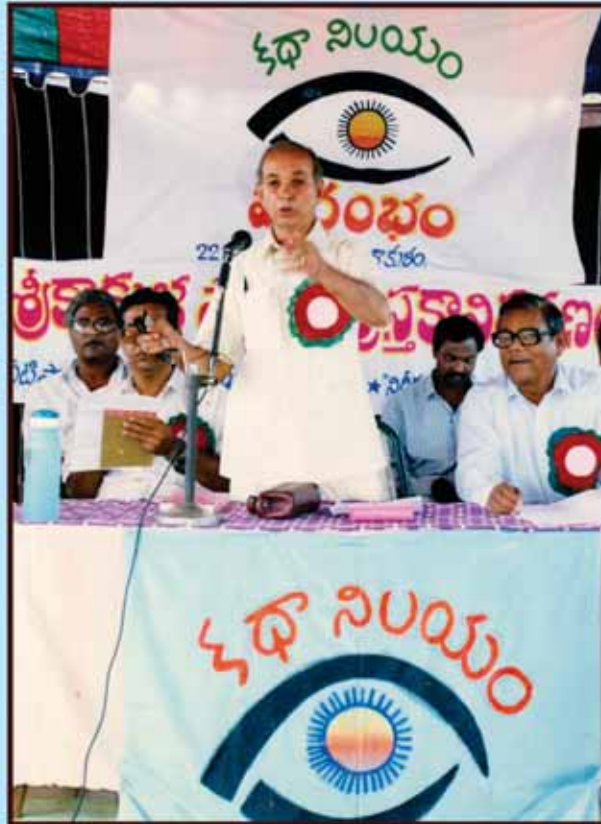
'కథానిలయం' ప్రారంభోత్సవ సందర్భంలో...