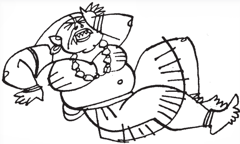
మన్మథ చెట్టయ్య కోయిలపాటి శార్వజ్ఞమ్

Owned, Edited, Printed and Published by Y.V.S.R.S. Sai :: Phone : 2707 1500 Corporate Office Address : "YADLAPATI's HOME"; 1-9-286/2/P, Vidyanagar, Hyderabad - 500 044 Printed at Charita Impressions, 1-9-1126/B, Azamabad, Hyderabad - 500 020