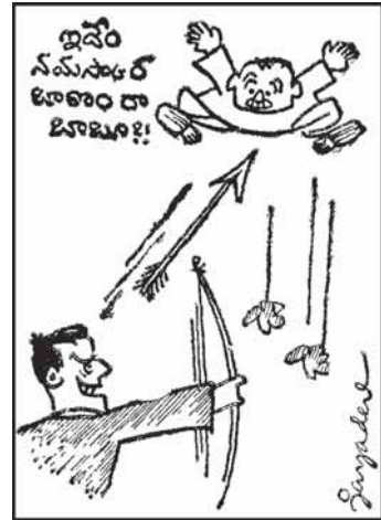
1. మొట్టమొదట శ్రీశ్రీకి నమస్కార బాణమేసి ప్రాస క్రీడల జాడల నవ్వించెద, కవ్వించెద!