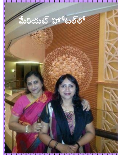
మేరియట్ హోటల్ లో

మేం ఆ కారులో వెళ్తూనే ఆ డ్రైవర్ తో మర్నాడు మాకు సిటీ టూర్ కావాలనీ, ఇలాగే ప్రొద్దుటే వచ్చి పికప్ చేసుకోవాలనీ మాట్లాడుకున్నాం.