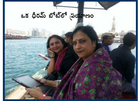
ఒక ధీరమ్ బోట్ లో ప్రయాణం

దుబాయ్ లో రెండు రకాల వెదర్లుంటాయిట. హాట్ వెదర్, వెరి హాట్ వెదర్. అంతే! అక్కడ రోడ్స్ మీద మనకి బైక్స్ కానీ ఇతర టూవీల్స్ కానీ కనపడవు. ఎందుకంటే ఆ వెదర్ వల్ల, వాటి రేట్లు అధికంగా పెంచి, కార్లు చవకగా అమ్ముతారట. ఒక బైక్ 1500 ధీరమ్స్ నుండి 80,000 ధీరమ్స్ వరకూ ఉంటుందిట. పదివేల ధీరమ్స్ కే కారు, కారుచవకగా వస్తుంది. 1.6 ధీరమ్స్ కి ఒక లీటర్ పెట్రోల్. మంచినీళ్ళు కూడా అంతే. పెట్రోల్ నీళ్ళలా వాడడం అంటే అదే!