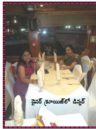
డైనర్ క్రూయిజ్ లో డిన్నర్

పక్కనుంచి వెళ్ళే షిప్పులు లైట్లతో ధగధలాడిపోతూ అందంగా కనిపించాయి. దాదాపు గంటన్నరపాటు భోజనంలో, డాన్స్ లో ఉండిపోయాం. తరువాత మళ్ళీ మమ్మల్ని మా హోటల్ దగ్గర దింపి, ప్రొద్దుటే 9.30కల్లా