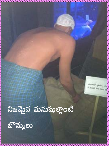
నిజమైన మనుషుల్లాంటి బొమ్మలు

పరాక్రమానికి సూచనట. ఇక్కడ రాతిపాత్రల యుగంలో కూడా స్త్రీల పూసల, రాళ్ళ నగలు చూస్తే స్త్రీల సౌందర్యాభిలాష తెలుస్తుంది. ఆ తరువాత జుబేరా రోడ్లోకి వెళ్ళాం.