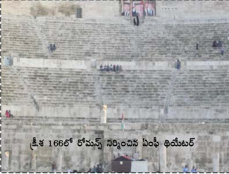
క్రీ.శ 166లో రోమన్స్ నిర్మించిన ఏంఫీ థియేటర్

జోర్డాన్ని పాలించిన హమ్మీటీ కుటుంబ సభ్యులు ఈ కోటలో నివసించేవారు. తర్వాత ఇంకో చోటుకి నివాసాన్ని మార్చారు.