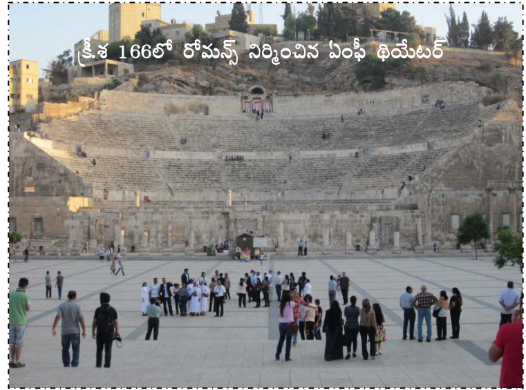
క్రీ.శ 166లో రోమన్స్ నిర్మించిన ఏంఫీ థియేటర్

మా వాన్ కొండ దిగి డాన్టాన్లోకి ప్రవేశించి కొద్ది దూరంలో ఉన్న క్రీ.శ 166లో రోమన్స్ నిర్మించిన ఏంఫీ థియేటర్ దగ్గర ఆగింది. ఈ ఏంఫీ థియేటర్లో ఆరువేలమంది కూర్చునే వీలుంది. రోమన్ థియేటర్ పక్కనే ఓడియన్ థియేటర్ ఉంది. ఇందులో ఐదువందలమంది కూర్చోవచ్చు. ఓడియన్ థియేటర్లో నేటికీ కచేరీలు, ఇతర ప్రదర్శనలు జరుగుతున్నాయి. అది బస్ స్టేషన్ పక్కనే ఉంది. ఆ రోజుల్లో అమ్మన్ పేరు ఫిలడెల్ఫియా. ఇది ఫోటో స్టాప్. అక్కడ ట్రాఫిక్ జామైంది. చుట్టుపక్కల సూక్స్ ( మార్కెట్లు) అనేకం ఉన్నాయి.