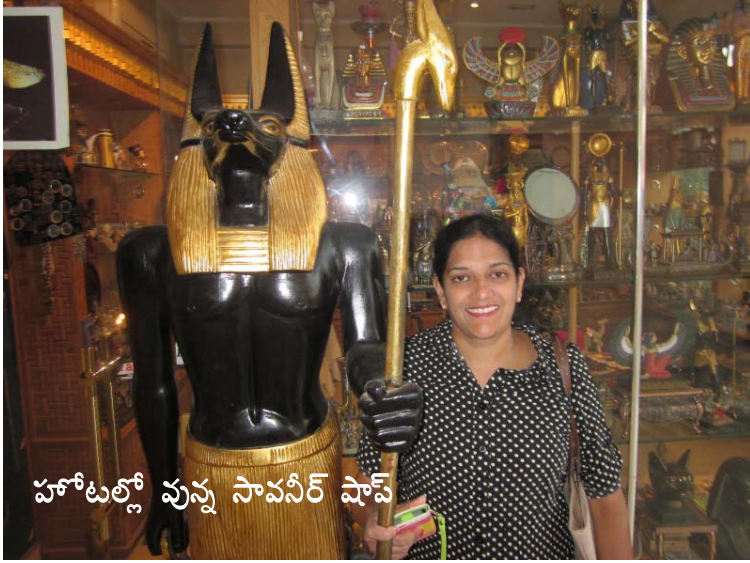
హోటల్లో వున్న సావనీర్ షాప్

మధ్యాహ్నం 1-45కి మా బస్ 'మూవ్ ఎన్ పిక్' హోటల్ ఆవరణలో ఆగింది. పెద్ద పెట్టెలని మా బస్ లగేజ్ కంపార్ట్మెంట్ లోంచి