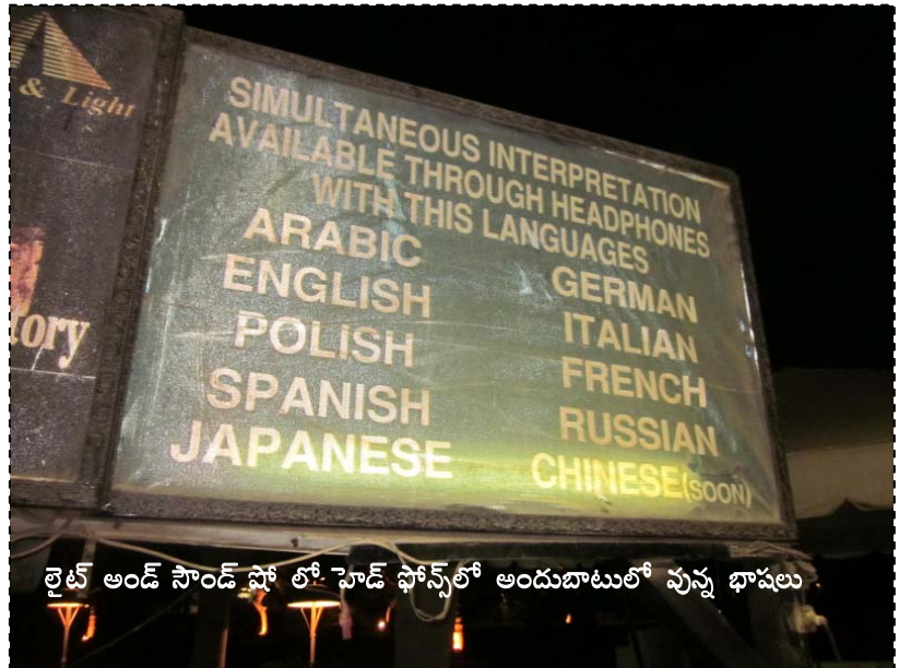
లైట్ అండ్ సౌండ్ షో లో హెడ్ ఫోన్స్లో అందుబాటులో వున్న భాషలు

లోపల దూరంగా ఎడారిలో పక్కపక్కనే ఉన్న మూడు పెద్ద, మీడియం, చిన్న పిరమిడ్స్, వాటి ముందు స్పింక్స్ విగ్రహం, దాని పాదం దగ్గర ఇతర కట్టడాలు కనిపించాయి. ఆ మసక చీకటికో చరిత్రకి చిహ్నాలుగా ఇప్పటికీ నిలిచివున్న ఆ పిరమిడ్స్ని చూస్తే, ఒక విధమైన గగుర్పాటు కలిగింది. వాటి ముందు ఓపెన్ ఎయిర్లో ఏర్పాటు చేసిన ఆ థియేటర్లో ఐదు వరసల్లో వెయ్యికి పైగా కుర్చీలు ఉన్నాయి. ప్రేక్షకులు రెండువందలు మించి లేరు. అంతా విడిపోయి స్టేజీకి దగ్గరగా