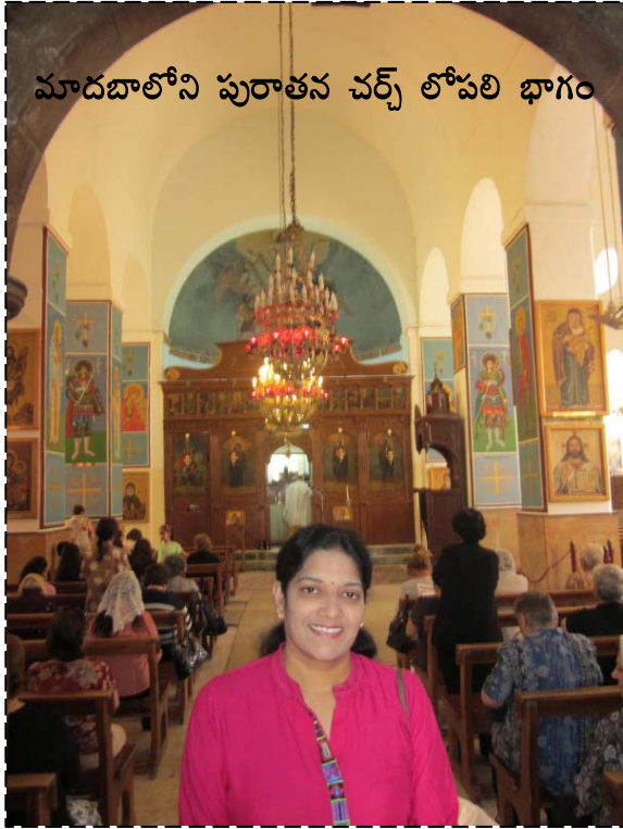
మాదబాలోని పురాతన చర్చ లోపలి భాగం

ముక్కలని ఖాళీ లేకుండా చేత్తో పేరుస్తారు. కావలసిన సైజ్ కి మొజాయిక్ ముక్కని కటర్ తో కట్ చేస్తారు. తర్వాత ట్రీజర్ తో ఆ ముక్కని కావలసిన చోట పేరుస్తారు. పూర్తయ్యాక మొజాయిక్ కి