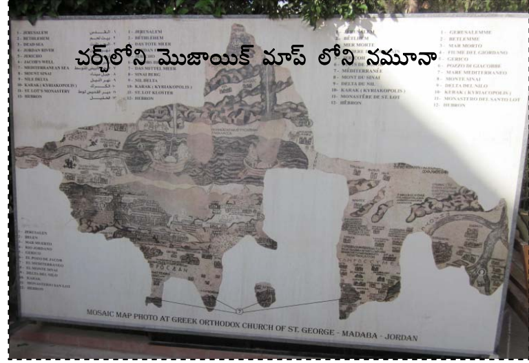
చర్చలోని మొజాయిక్ మాప్ లోని నమూనా

వెనక నించి బొమ్మ ప్రకారం రంగురంగుల చిన్న మొజాయిక్