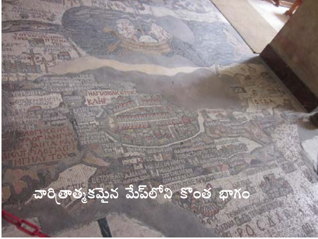
వారితాత్మకమైన మేప్ లోని కొంత భాగం

మమ్మల్ని జీనత్ మొజాయిక్ ఫేక్టరీకి తీసుకెళ్ళింది. మొజాయిక్ బొమ్మలని ఎలా రూపొందిస్తారో అక్కడ డిమాన్ స్ట్రెషన్ ఇచ్చారు. ఫ్రేమ్ లోని ట్రాన్స్ పరెంట్ అడ్డం మీద ఫ్రేమ్ కి