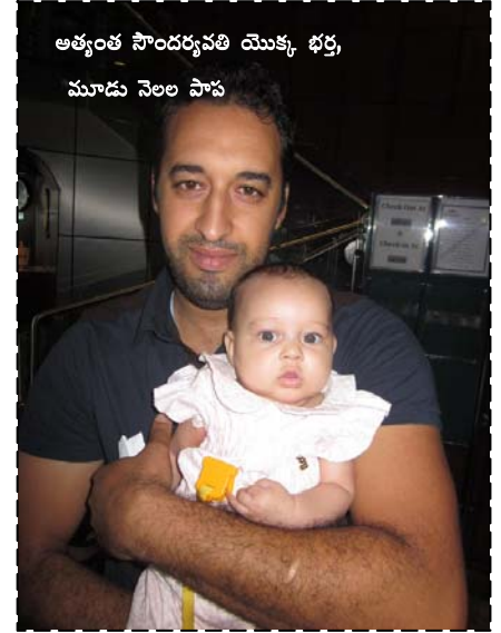
అత్యంత సౌందర్యవతి యొక్క భర్త, మూడు నెలల పాప

మీరు యూ ట్యూబ్‌లో ఈ ఆలయాల పేర్లు సెర్చ్ చేస్తే చక్కటి వీడియోలని చాలామంది పెట్టారు. ఇది చదివాక వాటిని చూస్తే మీకు చక్కటి అవగాహన వస్తుంది.