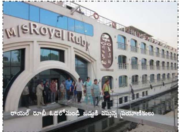
రాయల్ రూబీ ఓడలోనుండి ఒడ్డుకి వస్తున్న ప్రయాణీకులు

తర్వాతి స్టాప్ కి గంట ప్రయాణం కాబట్టి ఓడ సన్ డెక్ మీదే కూర్చున్నాం. ప్రయాణీకుల కోసం ఓ చోట స్నాక్స్ గా మూడు రకాల బిస్కెట్స్, టీ ఉంచారు. ఓ చోట పచ్చిక బయళ్ళలో మేసే పెద్ద గేదెలు కనిపించాయి. తాటిచెట్లు కూడా చాలా కనిపించాయి. ఈజిప్ట్లో, ఇతర దేశాల్లో ఈ నైలు నది వల్లే మనిషి జీవించగలిగి, సంపద పొందాడు. ఎక్కడ సంపద ఉంటే అక్కడ సంస్కృతి కూడా అభివృద్ధి చెందుతుంది. నదులున్న చోటే నాగరికత, సంస్కృతులు అభివృద్ధి చెందుతాయి. దాదాపు గంట ప్రయాణించాక మా ఓడ ప్రయాణించే