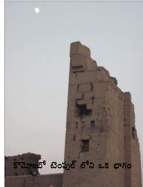
కొమ్మెంబో టెంపుల్ లోని ఒక భాగం

ఉత్తరం వైపున్న రెండో ఆలయంలో ఈజిప్ట్ ని, ఫారోలని రక్షించేగర్డ తల గల హరోస్ లేదా హరోరిస్ దేవత, టాసనే దేవతా విగ్రహాలున్నాయి. సీలింగ్ మీద ఎగిరే గర్డల దృశ్యాల మ్యూరల్స్ (చిత్రాలు) ఉన్నాయి. ఈ గుళ్ళోని స్థంబం మీద కూడా హరోస్ విగ్రహం, దాని ముందు మోకాళ్ళ మీద కూర్చున్న రాజు ప్రసాదాన్ని సమర్పిస్తున్న దృశ్యం ఉంది. దీనికి కేజిల్ ఆఫ్ ది ఫాల్కన్ అని పేరు. ఈ ఆలయ సముదాయాన్ని పోలమీలు తమ సార్యభౌమాధికారాన్ని చాటడానికి కట్టారు. హరోస్ అంటే అధికారానికి చికిత్సకి అధిదేవత. హరోస్ వంపు