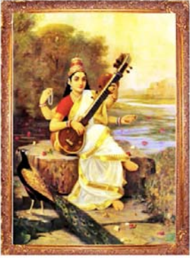
వరవీణ - సరస్వతీ రూపం