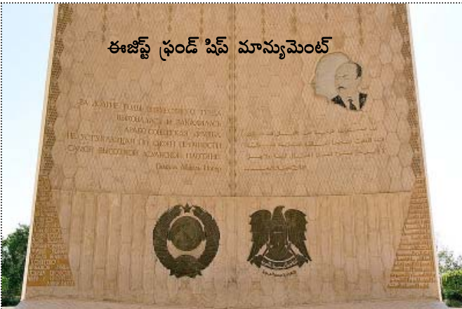
ఈజిప్ట్ ఫ్రండ్ షిప్ మాన్యుమెంట్

అక్కడ నించి ఐదు నిమిషాల్లో మూడున్నరకి అస్వాన్