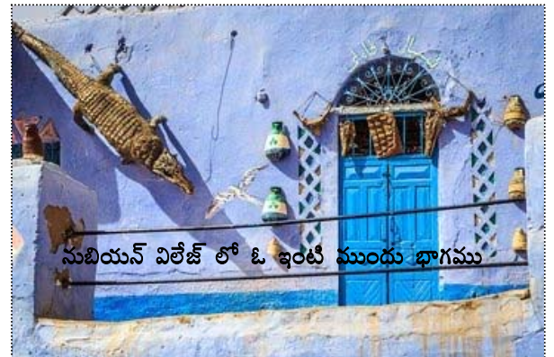
నుబియన్ విలేజ్ లో ఓ ఇంటి ముందు భాగము