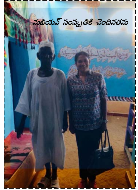
నుబియన్ సంస్కృతికి చెందినతను

"నిజానికి అది నుబియన్ గ్రామం కూడా కాదు. పదిహేను వందల గజాలకి మించని చిన్న ద్వీపం. అందులో పూరిళ్ళు ఉన్నాయి. వాళ్ళంతా నల్లటి ఆఫ్రికన్స్. గ్రామంలోని ప్రతీ ఇంట్లో చిన్న నీళ్ళ గుంటులున్నాయి. వాటిలో మొసలి పిల్లల్ని పెంచి, పెద్దయ్యాక నైలు నదిలోకి వదులుతారుట. మమ్మల్నా గైడ్ ఓ ఇంట్లోకి తీసుకెళ్ళాడు. అక్కడ హస్తకళల వస్తువులు అమ్మకానికి ఉన్నాయి. మట్టితో చేసిన మాస్కోలు, సన్నాయిల్లాంటి ఊదేవి, ధమురుకాలు, గవ్వలతో, పూసలతో