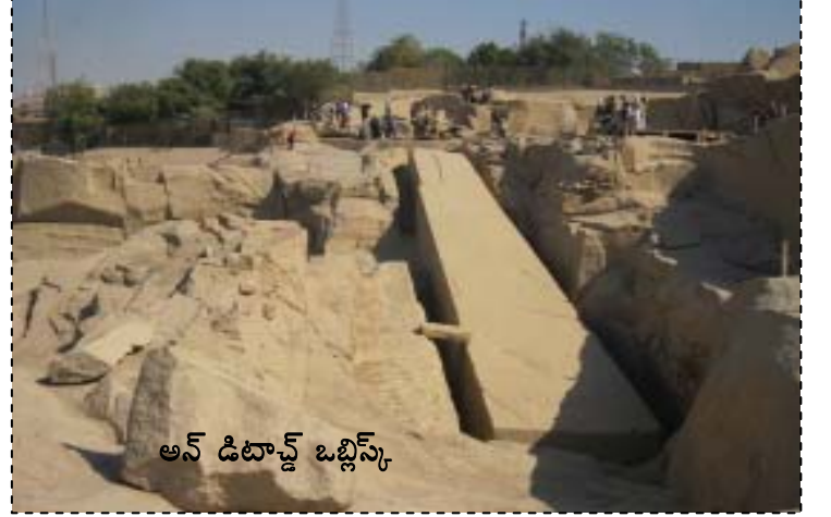
అన్ డిటాచ్డ్ ఒబ్లిస్కో

హోటల్ నించి అస్వాన్ డేమ్ కి బయలుదేరిన మా బస్, షుమారు మూడు గంటలకి సగంలో నిర్మాణం ఆగిపోయిన ఓ ఒబ్లిస్కో దగ్గర ఆగింది. అక్కడ గోధుమ రంగులో పెద్ద స్టోన్ క్వారీ ఉంది. ఇది ఓపెన్ ఎయిర్ మ్యూజియం. పైకి మెట్లున్నాయి. అక్కడ నేలమీదున్న ఓ పెద్ద రాతి మీద సగం చెక్కి వదిలేసిన స్థంభాన్ని చూసాం. దీన్ని 3,500 ఏళ్ళ క్రితం పద్దెనిమిదవ దైనాస్టికి చెందిన ఫారో రాణి హేట్ షెప్పెట్ నిర్మించింది. అందుకు నిపుణులైన పనివాళ్ళని నియమించింది. కానీ సగం చెక్కాక గ్రనైట్ రాతిలో పగుళ్ళు రావడంతో దాన్ని చెక్కడం ఆపేసారు. ఇది పూర్తై ఉంటే దీని పొడవు 148 అడుగులై ఉండేది. అప్పుడు ఇది ప్రపంచంలోని అతి ఎత్తైన ఒబ్లిస్కో ఉండేది. దీని బరువు కూడా 200 ఆఫ్రికన్ ఏనుగుల బరువుతో సమానమయ్యేది - 1100 టన్నులు. దాని దగ్గరకి వెళ్ళకుండా గొలుసులు అడ్డుగా కట్టారు.