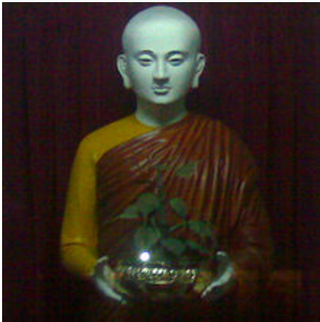
ఒక బౌద్ధ మఠంలో సంఘమిత్ర విగ్రహం

ఈ 47 ఏళ్లలో ఒక్కసారి కూడా తిరిగి పాటలీపుత్ర వెళ్ళలేదు, తనను ఎంతో ప్రేమించే తన తండ్రి అశోక మహారాజును దర్శించలేదు! ఆమె మరణం అప్పటి సింహళ రాజు ‘ఉత్తియ’ (Uttiya) పాలనా కాలంలో అనురాధపురలోని ఆమె స్వగృహంలో సంభవించింది. ఆమె ఉత్తర క్రియలు రాజు ఉత్తియ నిర్వహించటం జరిగింది. దహన కర్మకాండ ఆమె కోరున్నట్లుగానే బోధి వృక్షం ఎదురుగానే జరిగింది. వారం రోజులపాటు సింహళ ప్రజలు మౌనం పాటించారు. ఆమె అస్థికలు ఉంచిన చోట రాజు ఉత్తియ ఆమె స్థూపం నిర్మించటం జరిగింది.