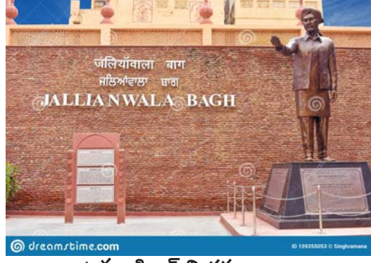
ఉద్ధం సింగ్ విగ్రహం