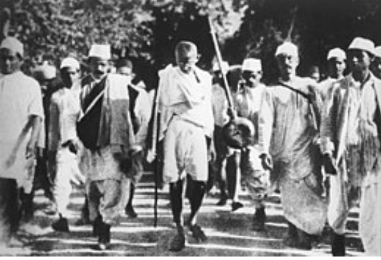
ఉప్పు సత్యాగ్రహంలో 61 ఏళ్ల గాంధీజీ

మరుసటి రోజు (ఏప్రిల్ 6: ఆదివారం) ఉదయం, ప్రార్థన తరువాత, గాంధీజీ ఉప్పుతో కలిసిఉన్న మట్టి బురదను పైకి లేపి, “దీనితో, నేను బ్రిటిషు సామ్రాజ్యపు పునాదులను కదిలిస్తున్నాను” అని ప్రకటించారు. ఆ తరువాత మట్టి బురదను సముద్రపు నీటిలో ఉడకబెట్టి, బ్రిటిషు చట్టాన్ని ధిక్కరిస్తూ ఉప్పును తయారు చేశారు. తనతో ఉన్న వేలాది మంది అనుచరులతో పాటు సముద్ర తీరాన ఉన్న ప్రజలను “ఎక్కడ వీలుగా ఉంటే అక్కడ” ఉప్పును తయారు చేయమని కోరటం జరిగింది. ఇతర ప్రదేశాలలో ఉన్న గ్రామస్థులను కూడా ఉప్పును తయారు చేయమని ఆయన కోరారు.