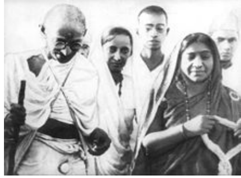
పాదయాత్రలో మహాత్మా గాంధీజీతో శ్రీమతి సరోజిని నాయుడు