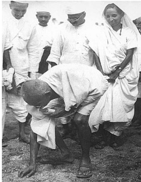
ఉప్పు యాత్ర ముగించిన సమయంలో వంగి ఉప్పు గల్లును పట్టుకున్న గాంధీజీ. ఆయన వెనక ఉన్న ఆయన రెండవ కుమారుడు మణిలాల్ గాంధీ.