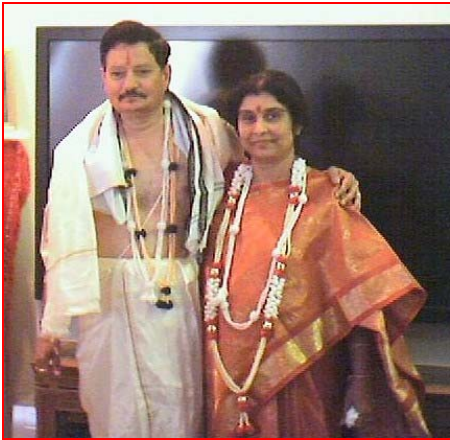
మా షష్టిపూర్తి - 2005