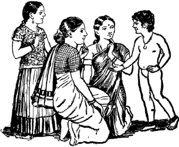
గోవిందరావుచేసిన చిత్రం | బివ్యద్యష్టి.

ప్రౌఢకవి కళ్ళు మూసి ధ్యానంలో పడ్డాడు ! ఊహాఁ ధ్యానంలోపడి కళ్ళుమూశాడు ! ఊహాఁ రెండూ నిజం కాదు; కవి కళ్ళు మూసి ఆలోచనలో పడ్డాడు. ఆఁ, ఇదే కొంత వరకు నిజం.