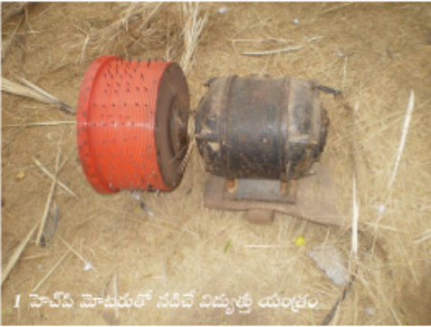
1 హెచ్చిన హెచ్చడలో నడిచే విద్యుత్త్ర యంత్రం