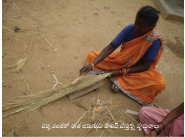
చెక్క పలకలో ఈత బరుగును పాలిష్ చేస్తున్న వృద్ధురాలు

"ఫస్ట్ ఇలా తయారు చేసినం. సక్సెస్ అయింది. దీనికన్న పని అల్కక ఉండాలని జెప్పి పాత ఇనుప సామాన్ల షాపుల పెద్ద పెద్ద సైపులు వస్తాయి. విజయవాడలో ఆ ప్లాస్టిక్ సైపులకి చక్కటి మూతలు కనిపించినాయి. వాటిని ఇనుప సామన్లలో వట్టిగనే పారేసేటోళ్ళు. అవి సూసై చెక్కతో పాటు ఇవి గట్టిగున్నాయి. అల్కగున్నయని జెప్పి ఆ చెక్కను పక్కన బెట్టి మూతను తలిగిచ్చినం. ఆహా... ఇది గూడ సక్సెస్ అయింది. ఇగ ఇప్పుడు దాదాపు పదిహేను, పద్దెనిమిది సంవత్సరాలైంది. మిషన తయారైంది. ఇది తయారైన కాన్నుంచీ దీనిమీదనే జీవనార్థం వెళ్ళిపోతున్నది."