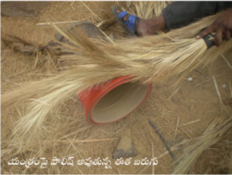
యంత్రంపై పాలిష్ అచ్చదున్న తుల బడుగు