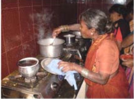
వంటంట్లో ఉన్న ఆనుభవం