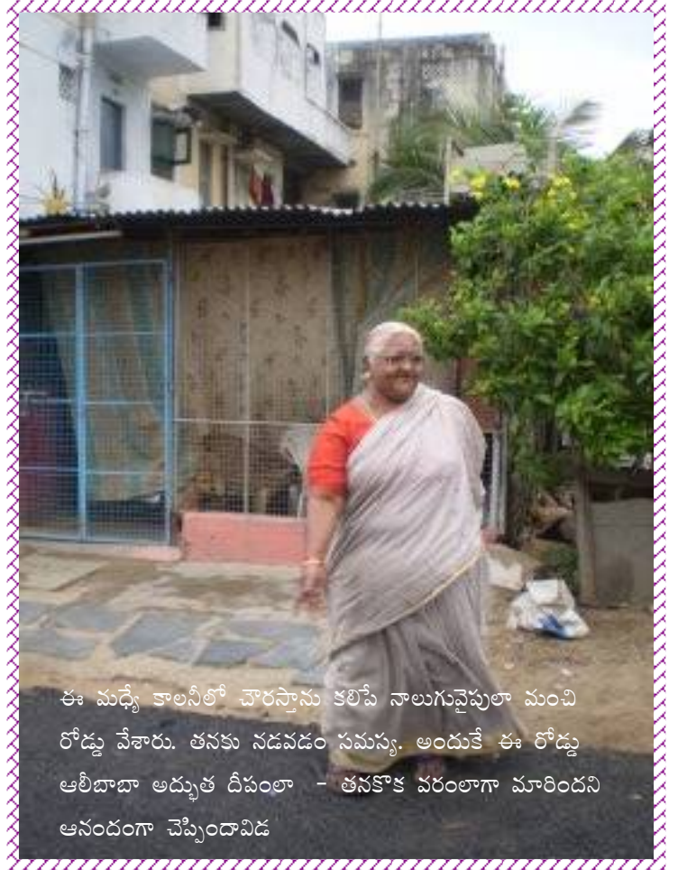
ఈ మధ్యే కాలనీలో చారస్సాను కలిపే నాలుగువైపులా మంచి రోడ్లు వేశారు. తనకు నడవడం సమస్య. అందుకే ఈ రోడ్డు ఆలీబాబా అద్భుత దీపంలా - తనకొక వరంలాగా మారిందని ఆనందంగా చెప్పిందావిడ

అడిగిన కొద్దీ ఉత్సాహంగా తన వివరాలు చెబుతోంది.