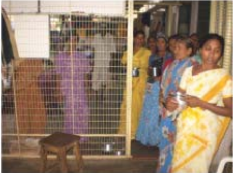
వంటశుభముందు మౌళ్య కట్టిన రోగుల బంధువులు