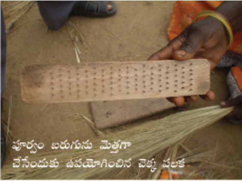
పూర్వం బరుగును మెత్తగా చేసేందుకు ఉపయోగించిన చెక్క చలక