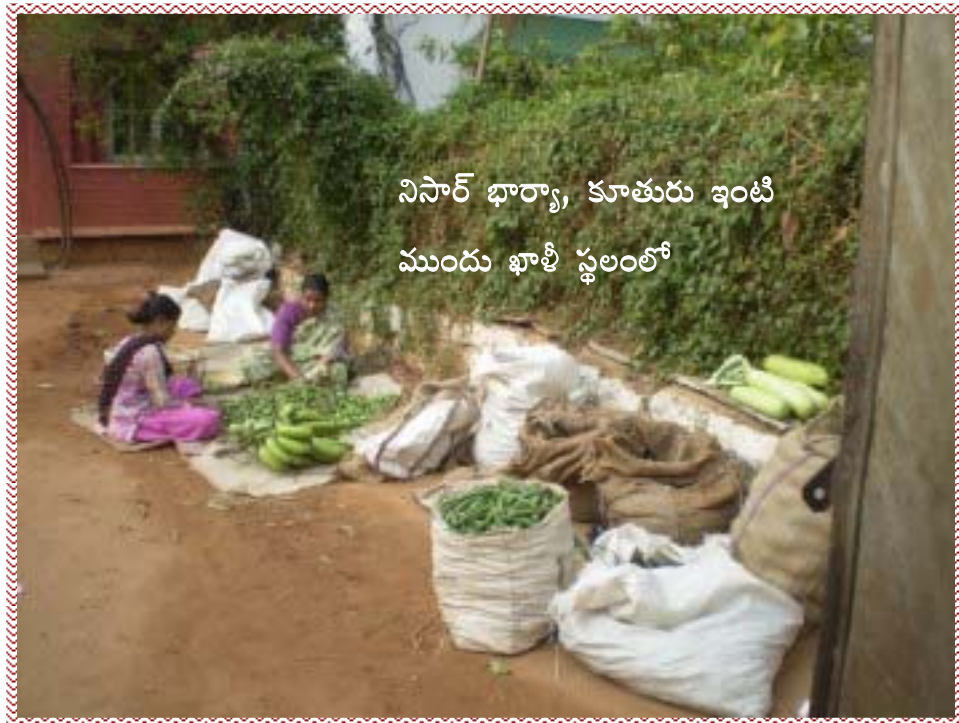
నిసార్ భార్య, కూతురు ఇంటి ముందు ఖాళీ స్థలంలో

మరో క్షణం అయ్యాక, మొదటినుంచీ అలవాటు లేదు.