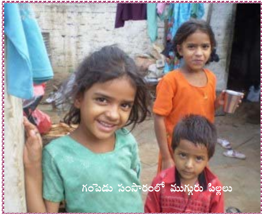
గంపెడు సంసారంలో ముగ్గురు పిల్లలు

ముందే చెప్పినట్లు, ఆయన తూకం లేకుండా కూరగాయలు అమ్ముతుంటాడు. అదే ఆయన ప్రత్యేకత.