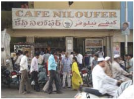
సాయంత్రం వేళలో కెఫె