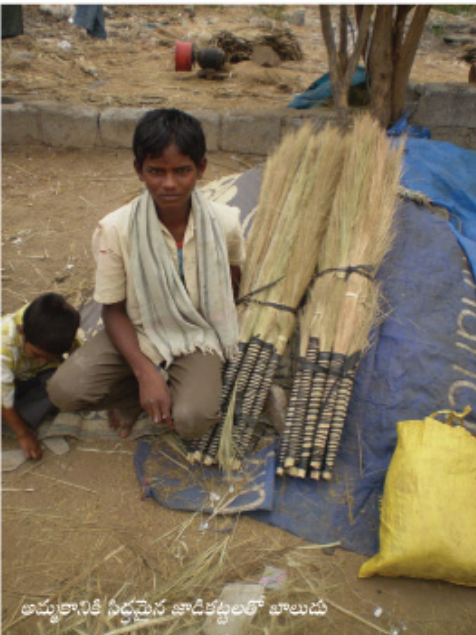
అమ్మకానికి సిద్దమైన జాడికట్టలలో తాలుడు

"ఆలోచించి దీన్ని ఫస్టు ముండ్లన్ని తీసేసి ఒక్క పదిజోసే బదులు వంద తయారుగావాల. వంద తయారు గావాలంటే ఎట్ల జేస్తోవాలె అని ఆలోచించిన. ఒక చెక్క తయారు జేసిన... చెక్కను తయారు చేసి... ఆ చెక్కని బాడిష ఉలితోని తొలిగట్టుకుని... ఈ ముండ్లు... సికిల పుల్లల ముండ్లు చక్కగా తెగ్గొట్టి... ఆ చెక్కకు సక్కగ కొట్టుకుని... ఆడ్మించి ఈ మిషన..."