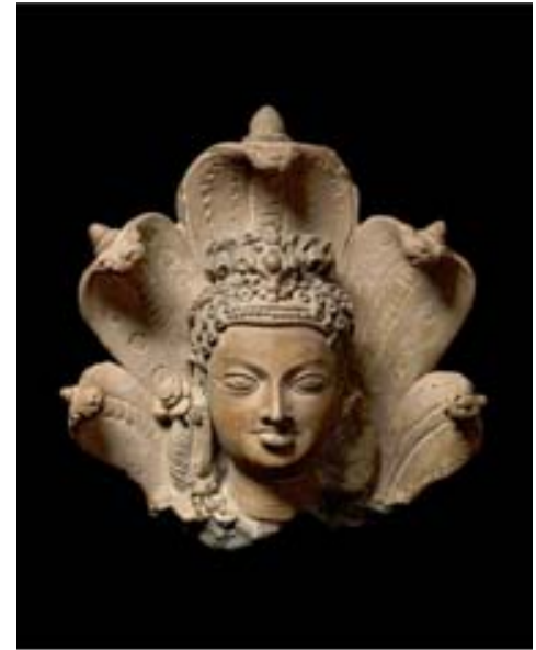
వేలానికి పెట్టిన 6వ శతాబ్దపు బిష్టువు తల